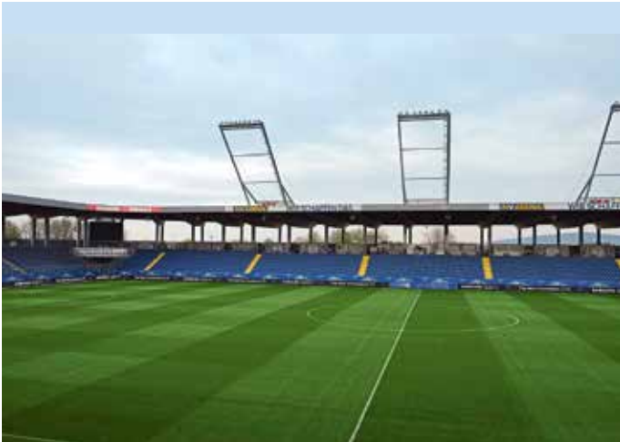
Das Stadion in St. Pölten wird von IFM Service betreut.