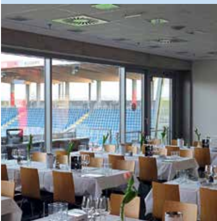
Der VIP-Businessclub eignet sich bestens zum Netzwerken.

Sladek | thomas.mayrhofer@rationell-reinigen.at